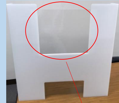
移動式パーテーション(小) ラミネートフィルム付 サイズ; 700Wx700Hx(150折り返し)